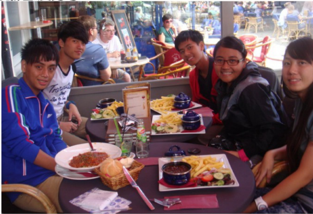
學生們於餐廳用餐