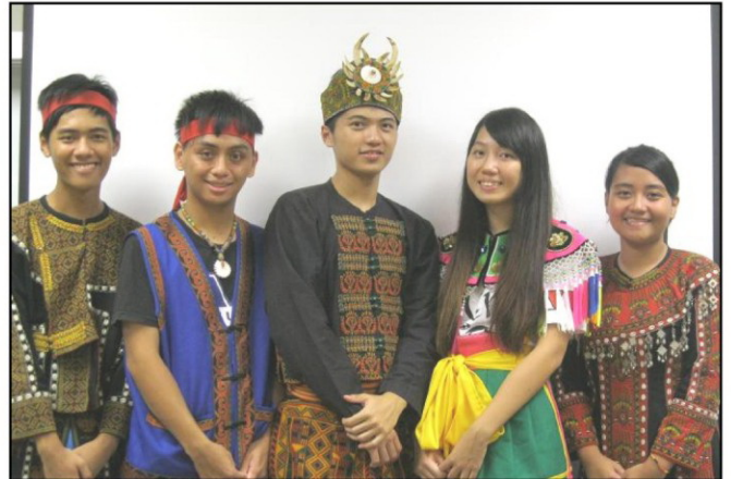
屏北高中原民班參加國際環保會議會學生