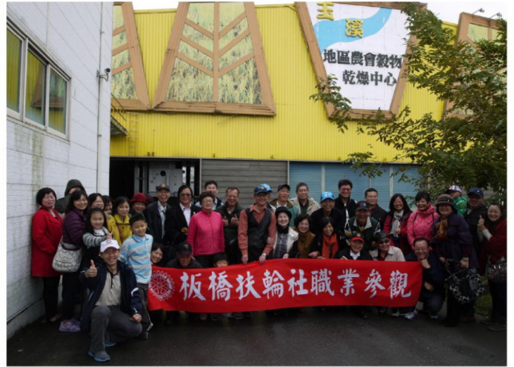
職業參觀-玉溪碾米廠