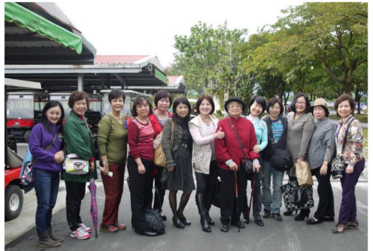
社友夫人與寶眷於兆豐農場留下美麗倩影