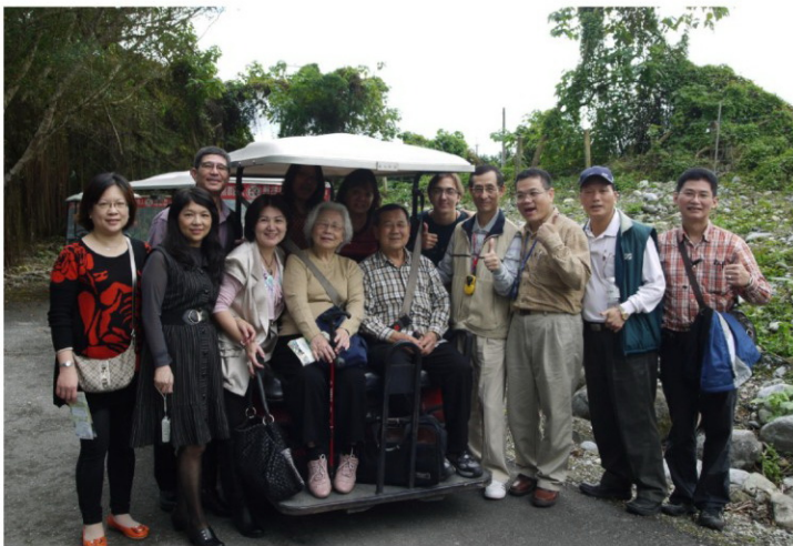
開高爾夫球車叭叭走