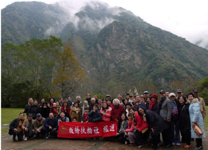
太魯閣國家公園-布洛灣合影