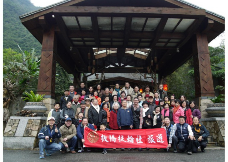
布洛灣-山月邨合影