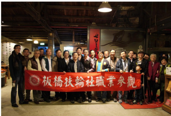
職業參觀-七星柴魚博物館