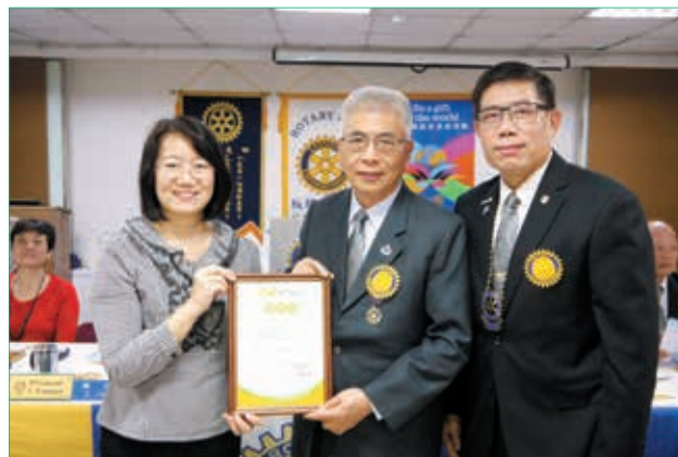
蘇院長回贈感謝狀