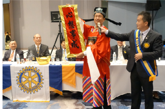
財神爺祝大家新的一年心想事成