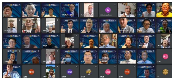
08.12 線上視訊會議圓滿成功!!