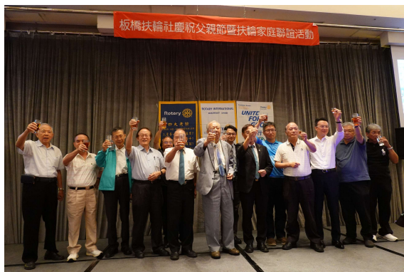
爐主感謝大家的蒞臨~